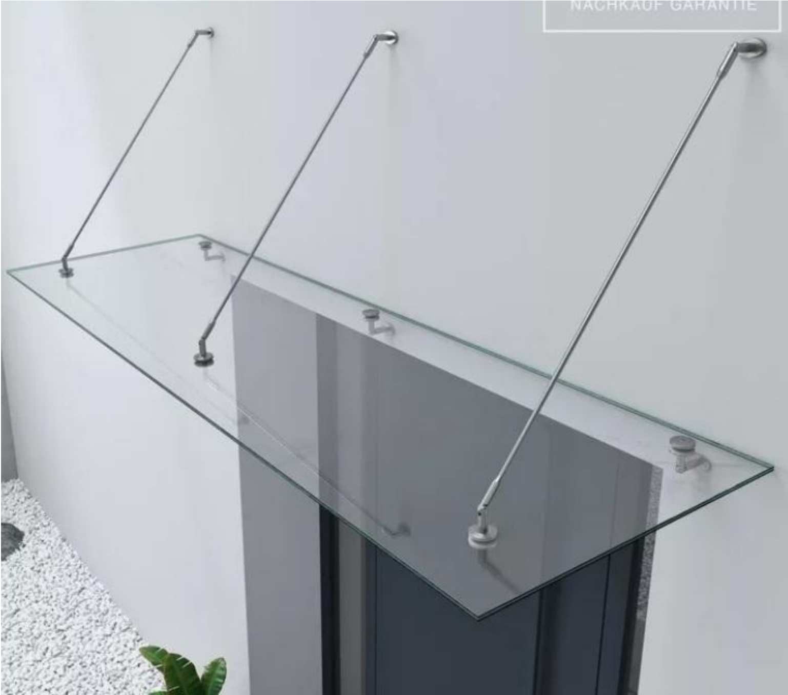
Skleněná stříška nad vchodové dveře s napínacími tyčemi (rozměr 300 x 90 cm)

Skleněná stříška nad vchodové dveře s napínacími tyčemi je vyrobena z vysoce kvalitního, částečně tvrzeného vrstveného bezpečnostního skla (VSG) s mezivrstvou fólií. Montážní tyče a kování jsou vyrobeny z nerezové oceli. Odolá zatížení 400 kg/m², snadno odolá i náklonům, jako je silný vítr, bouřky a sněžení. Skleněnou stříšku lze instalovat v úhlu sklonu až přibližně 3°, aby dešťová voda mohla snadno odtékat. Tato skleněná stříška je odolná vůči povětrnostním vlivům od -20 do 120 °C. Vrstvené bezpečnostní sklo je vyrobeno z několika jednovrstvých bezpečnostních skel (VSG). Dvě 6mm skleněné tabule jsou pevně spojeny průhlednou fólií SGP. Na nosné tyče a kování je použita vysoce kvalitní nerezová ocel. Montážní profily jsou vyrobeny z vysoce kvalitní nerezové oceli, která je robustní a odolná vůči korozi, a tím zajišťuje dlouhou životnost. Instalace je obzvláště snadná díky nastavitelným nosným tyčím. Poznámka : Nutno použít odpovídající kotvicí materiál určený pro konkrétní konstrukci zateplené zdi (tl.zateplení 140 mm minerální vaty) v souladu s montážními pokyny výrobce !!!